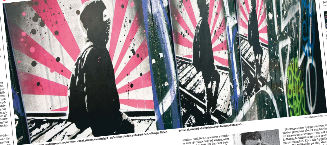
Gatukonsten har ingen beställare och kostar heller inte skattebetalarna något - utöver kostnaden att ta bort den, vill säga. Bilden är från planket på västra sidan av Folkets park i Malmö.